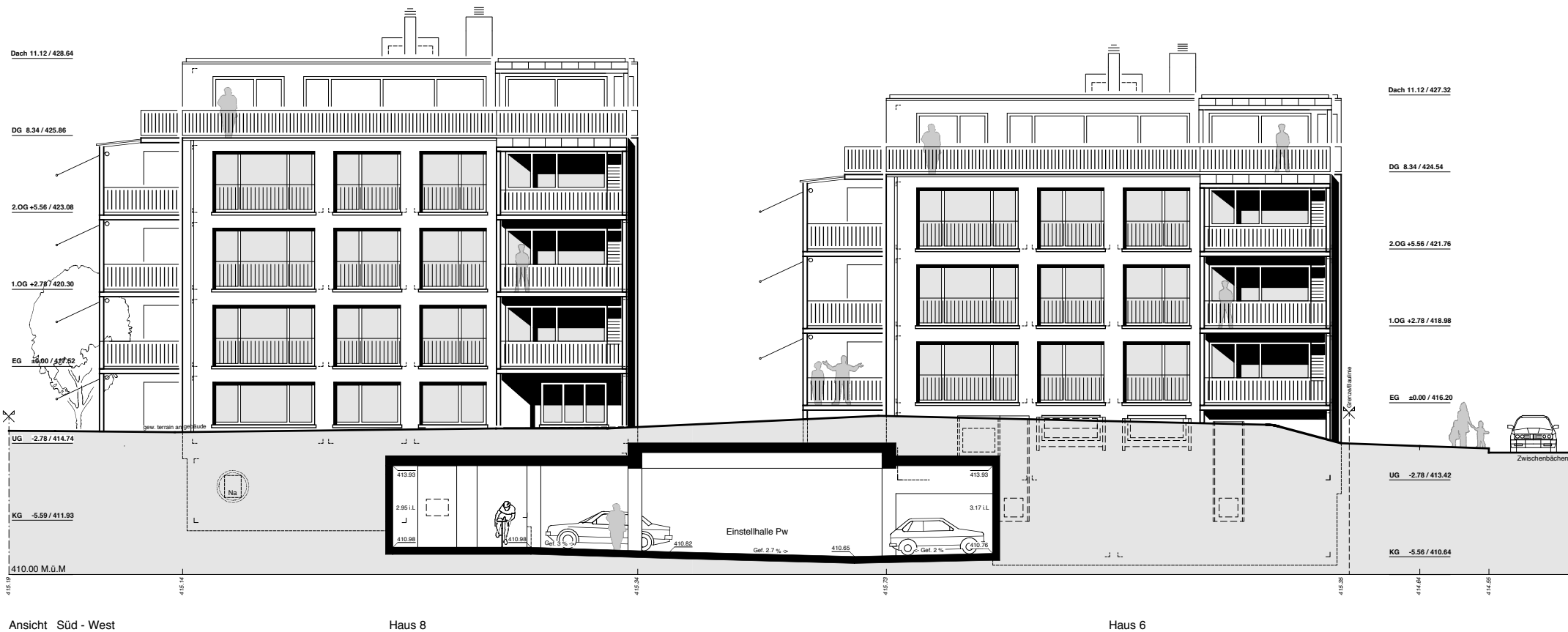
Ansicht Süd - West